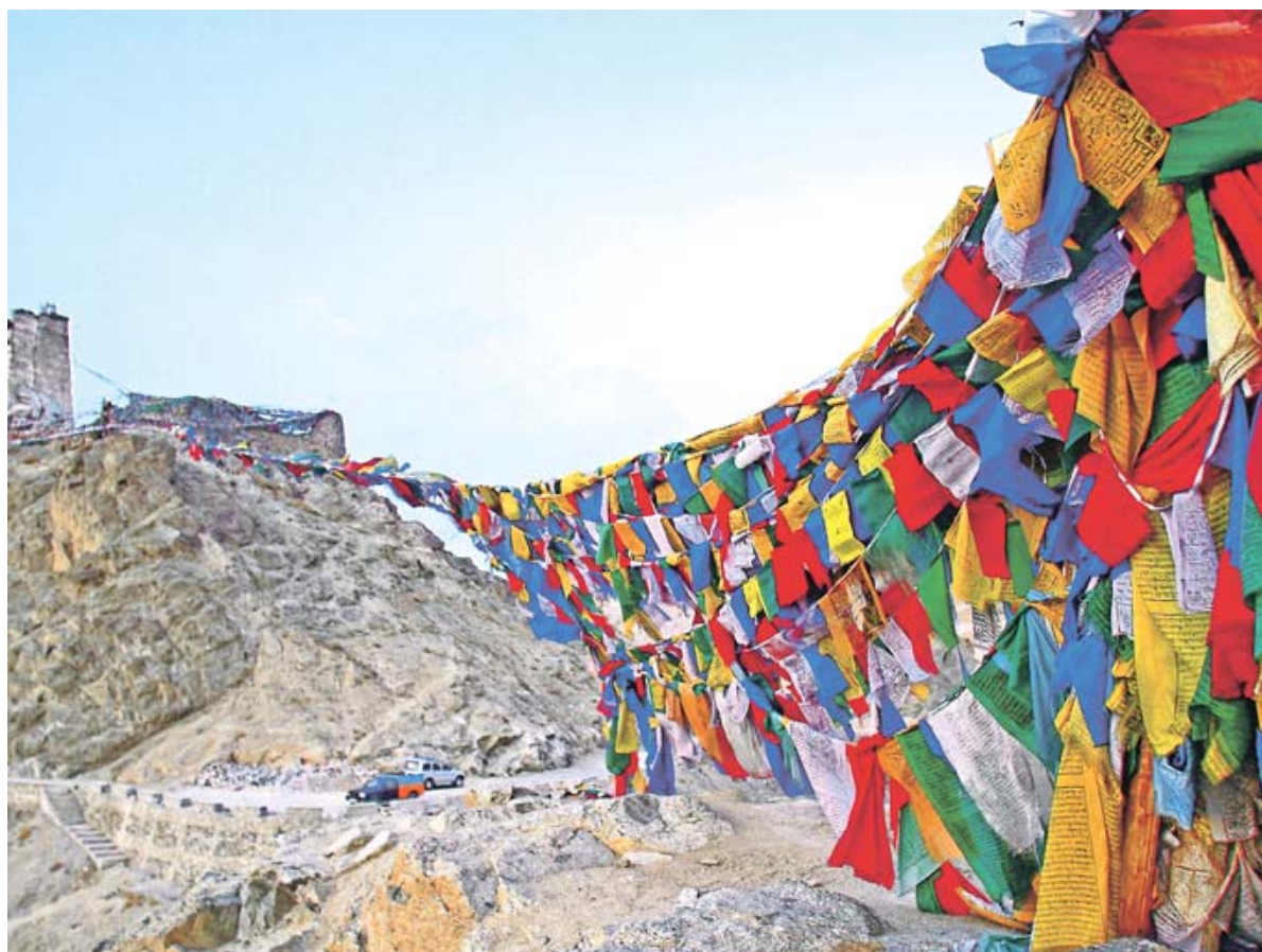
Der Glaube hat viele Farben: Gebetsfahnen sollen im eisigen Wind verwittern und dem Himmel die Gebete zutragen.

Thomas Bauer: Nurba – Im Reich des Schneeleoparden , Wiesenburg Verlag, 159 Seiten, 16,90 Euro.